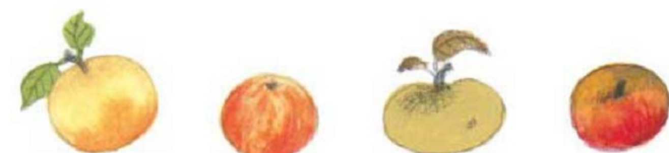
Mere renete Royal Gala Renet de Canada Bishop

Astăzi, avem în lume între 4 000 și 11 000 de soiuri de mere. Există atât de multe nume pentru aceleași soiuri, că până și specialiștii se mai încurcă.