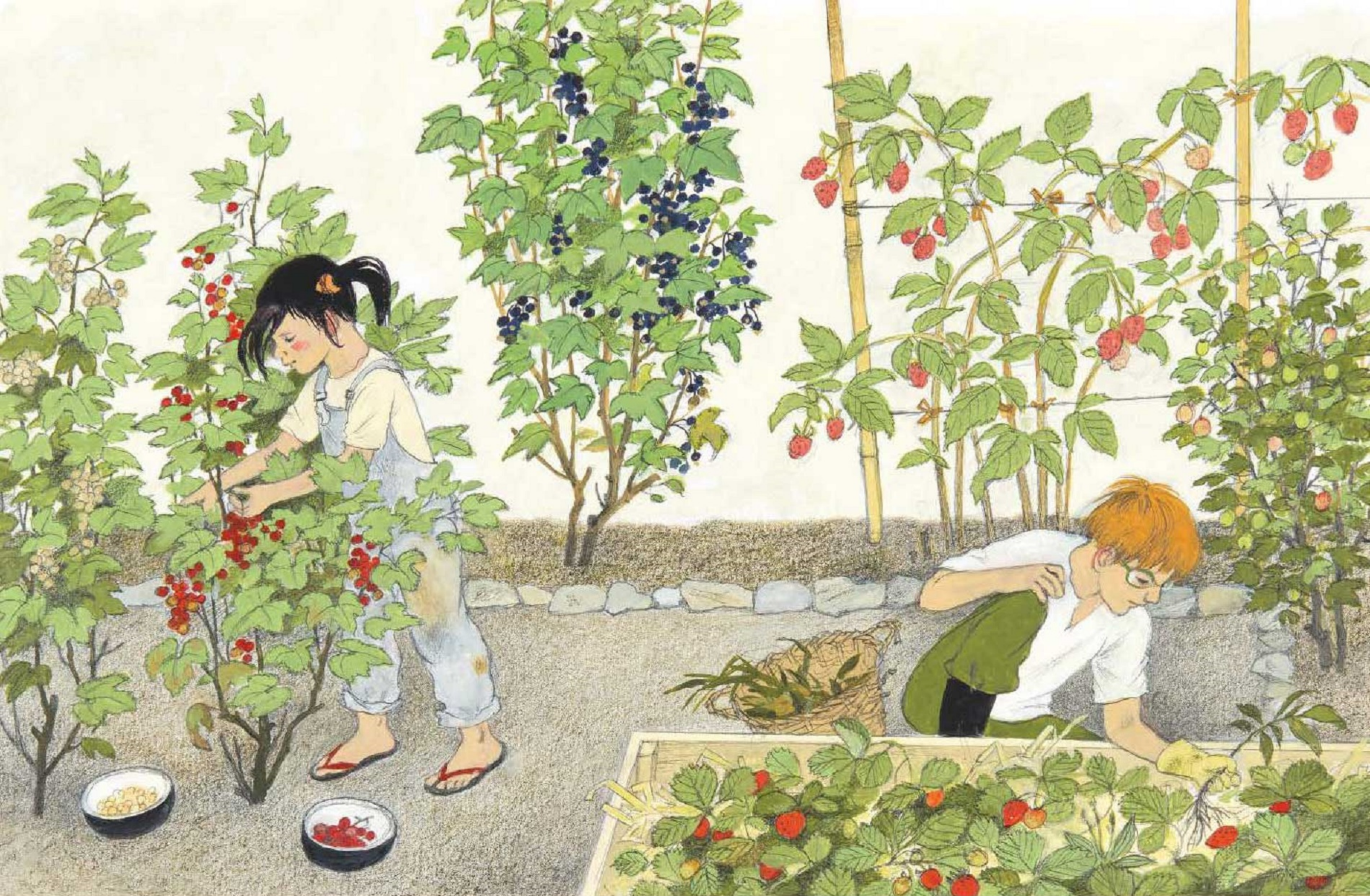
coacăze roșii și albe