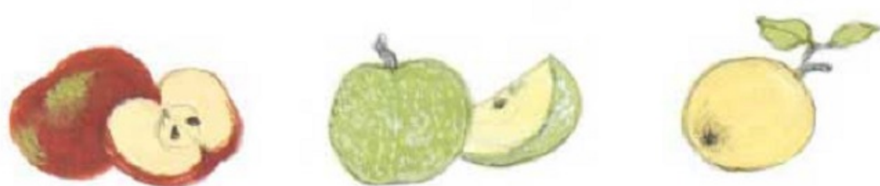
Roșu delicios (Red delicious) Mere verzi (Granny Smith) Mere galbene (Golden)